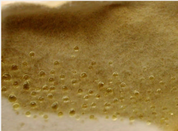
Junges Mycel mit Guttationstropfen